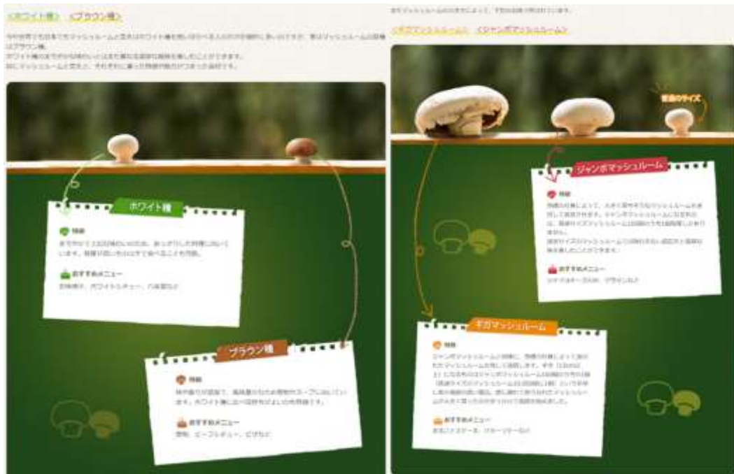
< マッシュルームの種類 >

マッシュルームは、ホワイト種、ブラウン種の2種があげられる。大きさによってジャンボマッシュルーム、ギガマッシュルームと呼ばれる種もあり、レシピによって多種多様な献立にマッチする。世界では、最も食べられているキノコであるが、国内ではまだ認知度は低く、国民一人当たり年間消費量は60g程度で、北欧に比べると2、3割程度の消費量であり、まだまだ伸びしろのある食材と言える。