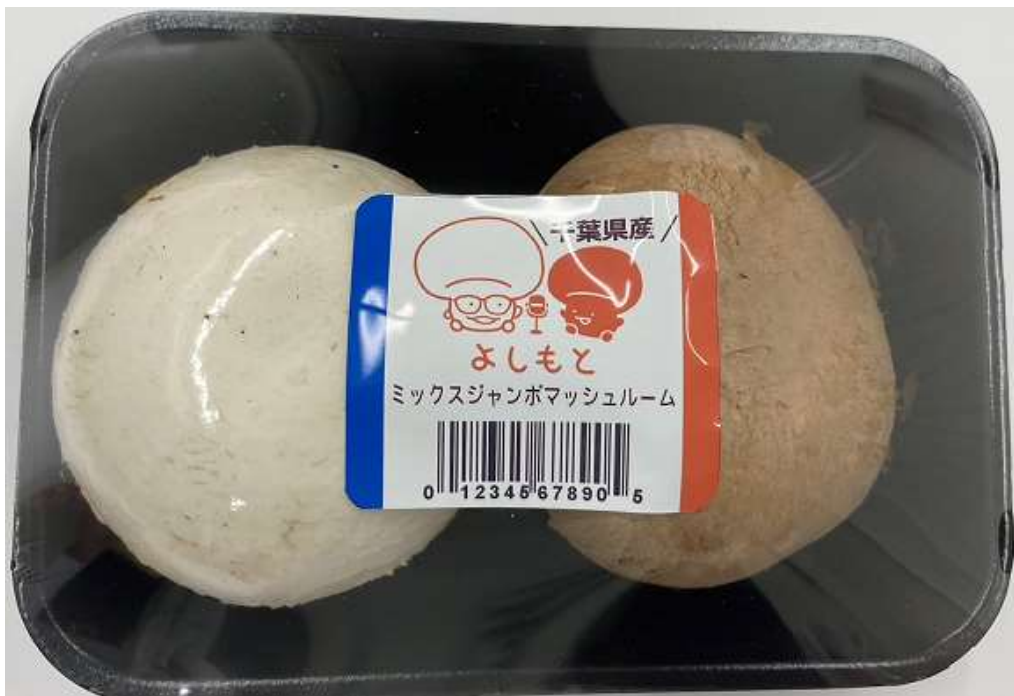
<『“芳源と吉本”マッシュルーム de コラボプロジェクト』商品>