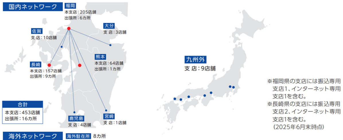
図表 2 : FFG の国内ネットワーク (2025 年 6 月 現在) 4