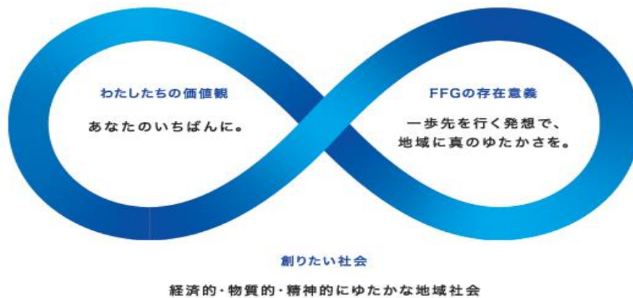
図表 3 : FFG の理念体系 5

FFG の理念体系は社員一人ひとりが持つべき考え方や行動のよりどころであり、FFG 経営の礎である。理念体系は、わたしたちの価値観「あなたのいちばんに。」、FFG の存在意義「一步先を行く発想で、地域に真のゆたかさを。」と創りたい社会「経済的・物質的・精神的にゆたかな地域社会」で構成されている。従業員一人ひとりが大切な”あなた”であるすべてのステークホルダーにとって”いちばん身近で、頼れて、先を行く”存在でありたいという「あなたのいちばんに。」の想いを持ち、FFG ならではの「一步先を行く発想で」、経済的なゆたかさだけでなく、誰もが安心や幸せを実感し、それが地域にめぐるとような「真のゆたかさ」を目指すものとなっている。わたしたちの価値観「あなたのいちばんに。」と FFG の存在意義「一步先を行く発想で、地域に真のゆたかさを。」の二つは互いに補い合い、創りたい社会への原動力になるとしている。