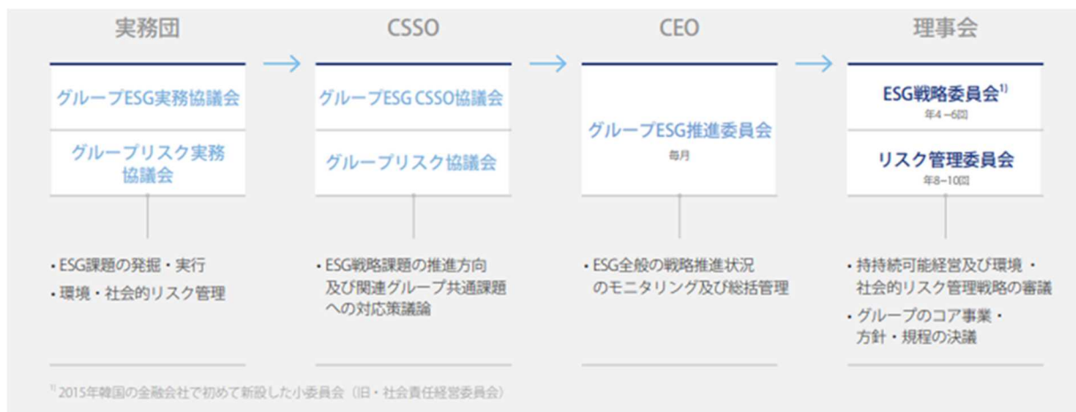
図 3：新韓金融グループのサステナビリティ推進体制 12

新韓金融グループのサステナビリティ推進体制としては、下図の通り、理事会傘下の ESG 戦略委員会とリスク管理委員会が持続可能経営及び環境・社会的リスク管理戦略の審議を行い、サステナビリティに関する方針を決議している。また、サステナビリティ方針をグループ会社が行えるように、2021年以降、全てのグループ会社の CEO が参加する ESG 推進委員会の指揮のもとでグループ ESG CSSO 協議会やグループリスク協議会等が具体的な実践計画を立てて実行に移す体制を整えている。なお、SBJ 銀行はグループ銀行ではないため、これらの協議会には参加していないものの、親銀行である新韓銀行を通じて、これらの方針を落とし込んでいる。