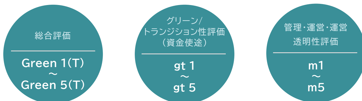
【JCR クライメートランジションファイナンス評価結果】

JCR のクライメートランジションファイナンスに関する評価は、総合評価である「JCR クライメートランジションファイナンス評価（Green 1(T)～Green 5(T)）」を中心に、グリーン/トランジション性評価（gt1～gt5）、管理・運営・透明性評価（m1～m5）を併記することにより表示する。