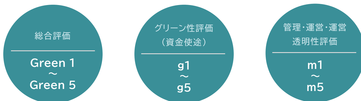
【JCR グリーンファイナンス評価結果】

JCRのグリーンファイナンスに関する評価は、総合評価である「JCR グリーンファイナンス評価（Green 1～Green 5）」を中心に、グリーン性評価（g1～g5）、管理・運営・透明性評価（m1～m5）を併記することにより表示する。